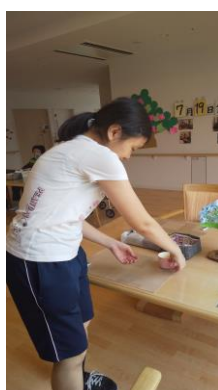
老人保健施設で活躍