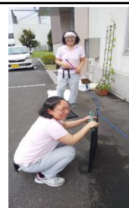
フィルター清掃でスッキリ