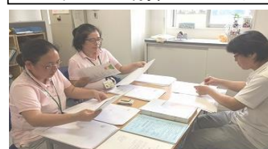
本部各部署からの依頼作業に活躍