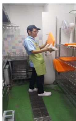
病院内のレストランで活躍