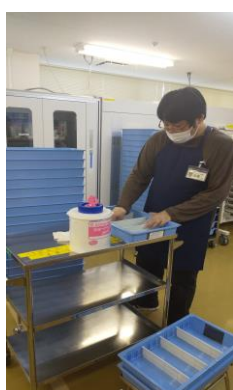
病院薬剤科で活躍