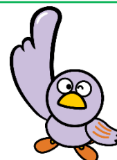
埼玉県のマスコット「コバトン」