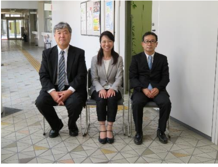
障害者雇用開拓・チャレンジ体験スタッフ