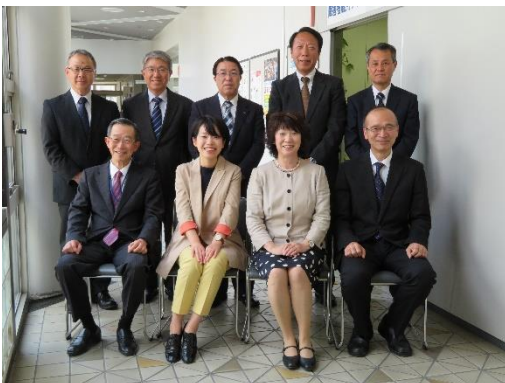
企業支援アドバイザー、事務スタッフ

新しいスタッフも加わり、今年度も障害者雇用の促進と定着を進めてまいります。どうぞよろしくお願いたします。