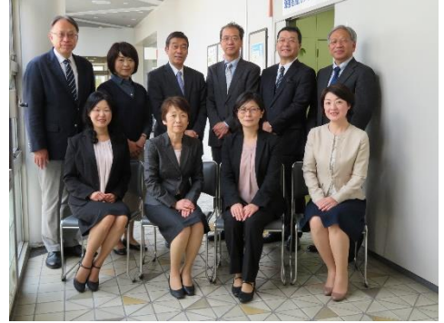
精神障害者就業促進スタッフ

精神障害者の雇用が進む中、雇用の拡大とともに「定着」を図ることがますます重視されています。採用前、採用後の企業内研修等のご相談に応じ、精神障害者の雇用に関する様々な支援を関係機関と連携して実施してまいります。