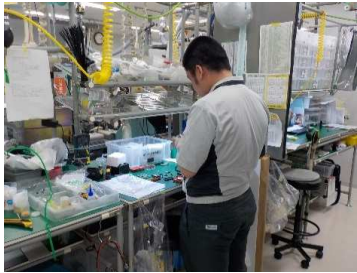
メンテナンス作業室内