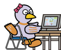
埼玉県マスコット「コバトン」