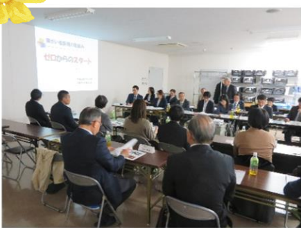
県西地域「情報交換会」 於：株式会社彩裕フーズ

県西は十五日に実施し、Ⅰ部 は十五社十八名・六機関七名、 Ⅱ部は十三社十四名の参加が