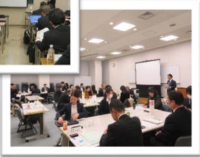
県南地域「事業主支援ワークショップ」 於：日新情報システム開発株式会社