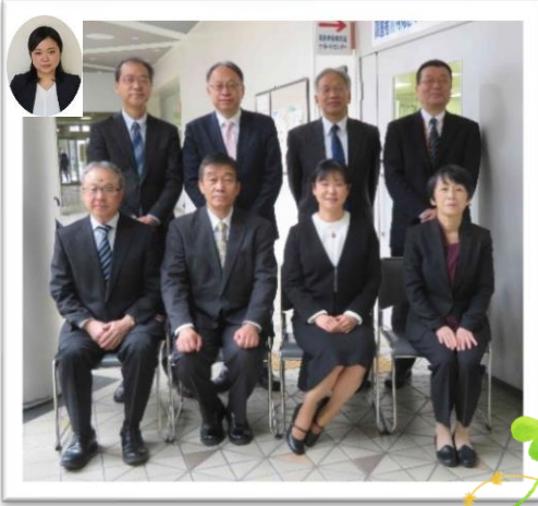
精神障害者就業促進スタッフ

企業支援アドバイザー、精神障害者雇用アドバイザー、PSW（精神保健福祉士）、障害者雇用・チャレンジ推進員とともに県南、県西、県東、県北・秩父の地域に担当者を配置しておりますので、障害者雇用に関する相談等、お気軽にご連絡ください。