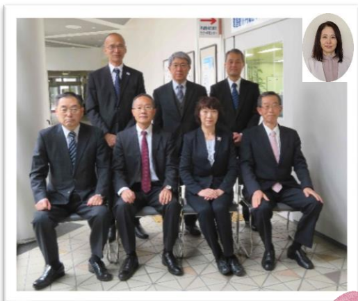
企業支援アドバイザーと事務スタッフ

今年度は新たな企業支援アドバイザー二名、精神保健福祉士一名、障害者雇用チャレンジ推進員一名、